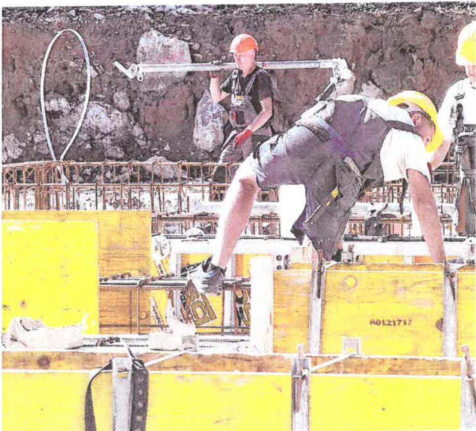
Iako se najviše nesreća događa u industriji, onih s tragičnim ishodom najviše je u građevinarstvu

Unatoč zakonima i EU direktivama, u Hrvatskoj i dalje nema sustavnog osposobljavanja radnika za siguran rad, a strani radnici posebno su izloženi rizicima jer dolaze bez adekvatne obuke